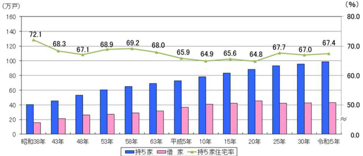
表3 持ち家数及び借家数の推移（昭和38年～令和5年）