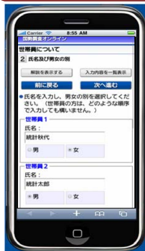
スマートフォン版電子調査票画面