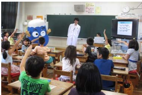
静岡市立駒形小学校