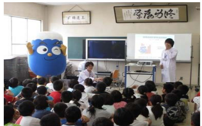
富士市立大淵第一小学校