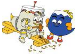
ふじっぴー静岡県