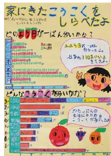
<静岡県知事賞:第1部>