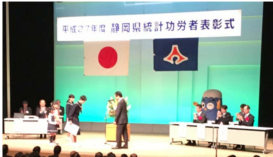
<27年度静岡県統計功労者表彰式>

県知事賞等は、静岡県統計功労者表彰式において表彰します。 平成28年度は、11月29日(火)に「しずぎんホールユーフォニア(静岡市)」にて開催し、併せて優秀作品の展示も行う予定です。