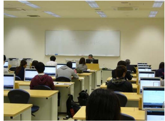
< 静岡産業大学 >