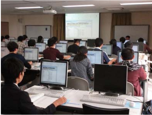
< 静岡大学 >