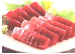
かつお漁獲量 全国に占める割合 (平成27年)

昼食(西伊豆町仁科付近) 海鮮丼で静岡の魚に舌鼓♪ 静岡のかつおの漁獲量は日本一!!