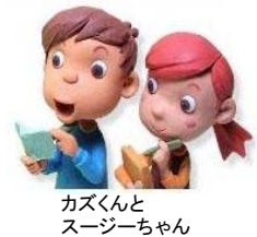
カズくん スージーちゃん

メール toukeiriyou@pref.shizuoka.lg.jp FAX 054-221-3609